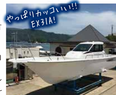
やっぱりカッコいい!! EX31A!

日本三景「天橋立」に程近い宮津営業所からは、EX31Aをご紹介します! 5月25日にできたてのぼやぼやのEX31A×6LY2-WST(380Ps)がヤンマー造船より陸路で入荷しました!!ご注文いただいたから半年以上お待ち頂きましたが、お客様の要望に沿った工場オプションを取り入れ、ゼロからお造りさせていただきました。海の幸の宝庫「日本海」で最高の釣行を楽しんで頂く為に、さらにこだわりの艀装をこれから施していきます。理想のカスタム艇にすべくスタッフ一同がんばりますよ~!!!