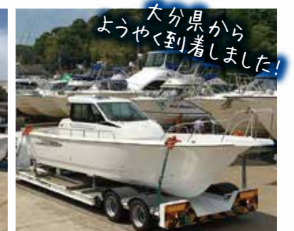
大分県からようやく到着しました!

ヤンマー宮津営業所 京都府宮津市宇獅子崎小字しぎの浜両側849 TEL 0772-22-6265