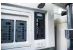
陸電ブレーカーパネル