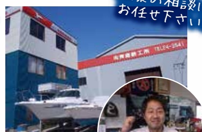
艀装の相談はお任せ下さい!