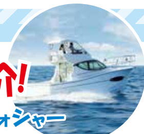
デッキウォシャー

これは、EX34に限ったことではないですが、魚釣りをするにあたり、デッキウォシャーは必需品と言っても良いアイテムです。魚が釣れた時などに、海水で、デッキを洗うことが出来ます。マリーナ等へ帰ってから、真水(水道水)で洗うことをお勧めします。