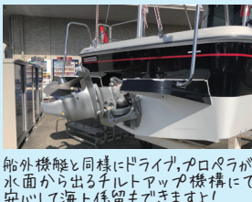
船外機と同様にドライブ、プロペラが 水面から出るチルトアップ機構にて 安心して海上係留もできますよ!