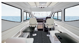
大勢のお客様がキャビンに入った瞬間、「すばく 視界がいい!」と驚かれます。何とインバーター マリンエアコンも標準装備。 もちろん100V電源もお使いいただけますよ!

「乗る喜び」、「釣る喜び」に コンセプトに 居住空間を最大限に グレードアップ!