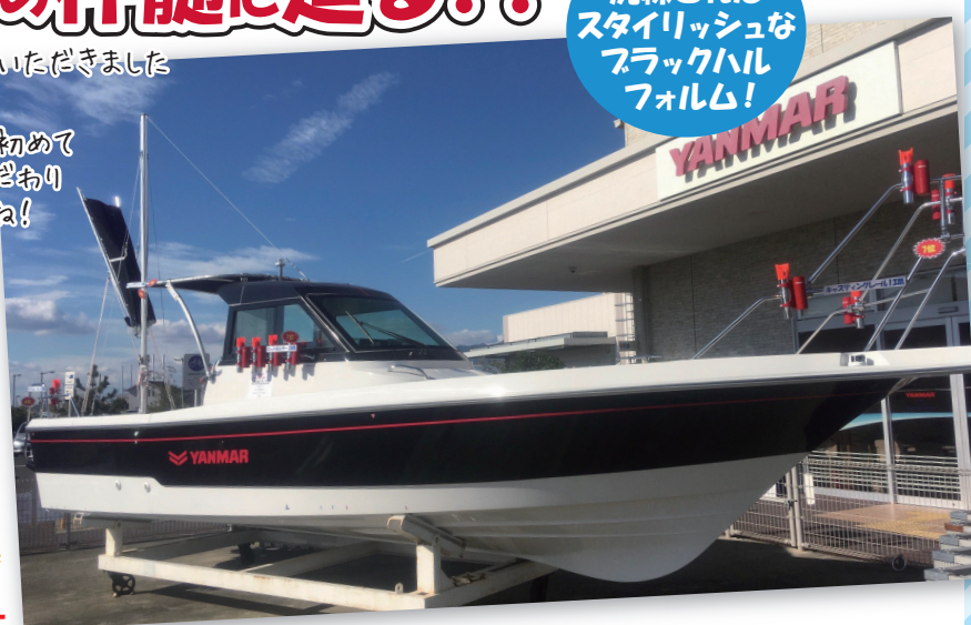
輸入車にも多く施工されている特殊な「パッケージシート」を採用し、 引き締まったツートンカラーで、釣り場でも人気の的ですよ! (お客様好みのカラーにも対応できます)