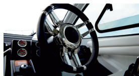
ブラックで統一された大型コンソール。 ヨーロピアンステアリング採用により 操船する楽しさを演出しています!