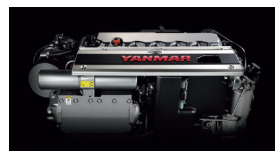
クラス最高の高出力エンジンに 防振支持、床防音構造、消音器の装備で クラス最高の低騒音を実現。

EX34-HTは現在、満を奏して全国でキャラバン試乗会を展開しております! 関西地区については年明けに、セカンド試乗会を予定しておりますので、詳しくは次号のヤンマー便り (WEB配信版)にてご案内させていただきます! ぜひ乞うご期待くださいね!