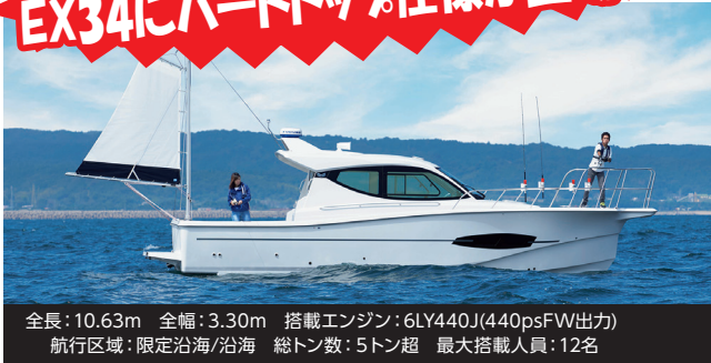
全長: 10.63m 全幅: 3.30m 搭載エンジン: 6LY440J(440psFW出力) 航行区域: 限定沿海/沿海 総トン数: 5トン超 最大搭載人員: 12名