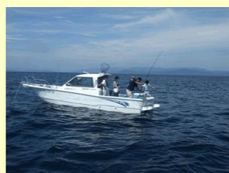
■ポイントの潮上に アンカーを落とし…