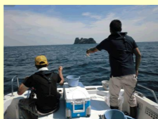
■根に向かって 仕掛けを投入します。