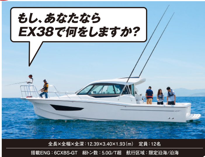
全長×全幅×全深: 12.39×3.40×1.93(m) 定員: 12名 搭載ENG: 6CXBS-GT 総トン数: 5.0G/T超 航行区域: 限定沿海/沿海

皆様、もしEX38をご購入されたなら、何をして遊ばれるでしょうか? やはり釣りでしょうか? それともご家族やご友人との週末クルージングでしょうか? この夏発売のEX38には、そんな皆様のワクワクを叶える装備や機能、スペースが満載です。実際に、ご契約・ご商談をされているお客様は、こだわりの釣り装備や内装にカスタマイズされています。是非、今度のフローティングボートショーでは、実際にご覧頂き、想像を膨らませてみてください。