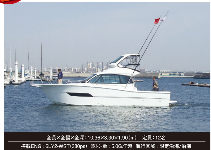
全長×全幅×全深: 10.36×3.30×1.90(m) 定員: 12名 搭載ENG: 6LY2-WST(380ps) 総トン数: 5.0G/T超 航行区域: 限定沿海/沿海

今回は、家族がゆっくり寛げる居住空間が支持され好評頂いているEX33II。広いキャビンの魅力をもっと引き出す為に、ヤンマー造船より内装レスのEX33IIをオーダー致しました。ハルカラーはサンドブラウン! 実は、このハルカラーもお客様から大変ご好評頂いているんです。そんなEX33IIを関西フローティングボートショーに向けて..