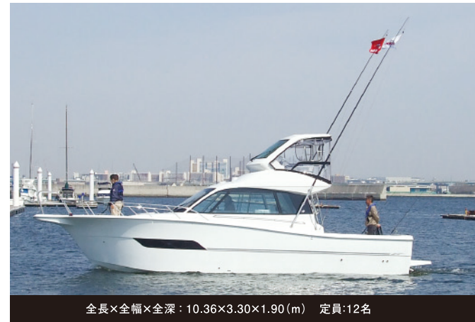
全長×全幅×全深：10.36×3.30×1.90(m) 定員：12名