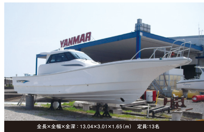
全長×全幅×全深：13.04×3.01×1.65(m) 定員：13名

皆様のご要望にお応えしました釣楽PROを搭載して、今回 も登場!もう試してみられましたか?オートスラスターと釣楽 リモコンをひとつにすることで最上級のフィッシングポートに 生まれ変わり、あらゆる釣りシーンに対応できます。 是非、会場でご確認ください。また、EX40IIが今までで一番気 に入っているというオーナー様のお声をご紹介します!!