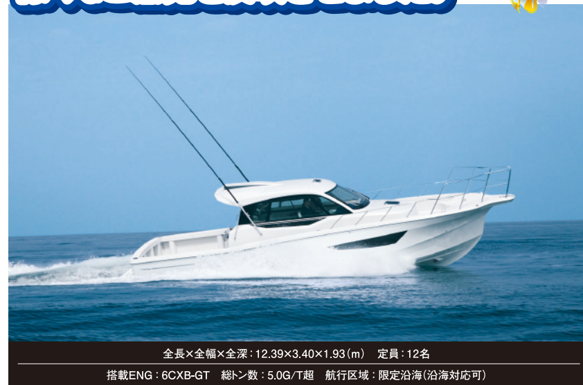
全長×全幅×全深: 12.39×3.40×1.93(m) 定員: 12名 搭載ENG: 6CXB-GT 総トン数: 5.0G/T超 航行区域: 限定沿海(沿海対応可)

今年のジャパンインターナショナルポート ショー2015に参考出品し、大注目となり ましたニューモデル「EX38」が関西ポート ショーで初めてフローティング展示されます。