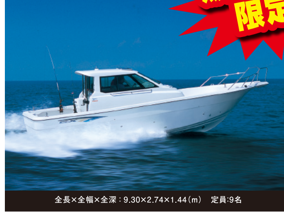
全長×全幅×全深：9.30×2.74×1.44(m) 定員：9名