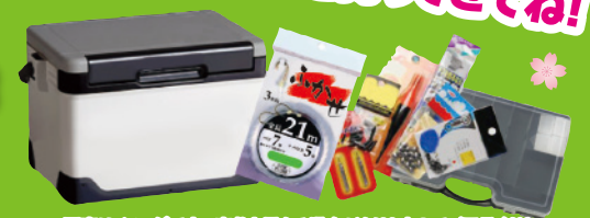
※写真はイメージです。実物と異なる場合がありますのでご了承ください。