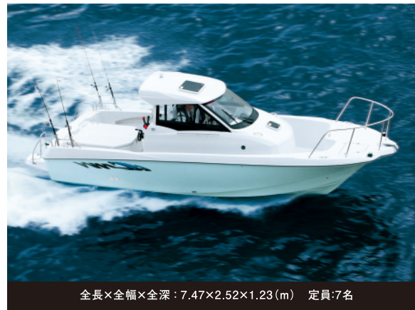
全長×全幅×全深：7.47×2.52×1.23(m) 定員：7名

丈夫で長持ち、その上、経済性に優れているディーゼル艇!! 24フィートという扱いやすいサイズでマルチドライブ搭載。 初めてのボート購入で悩んでいるならコレがオススメです!!