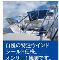
自慢の特注ウインドシールド仕様。オンリー1機装です。