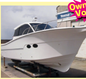
EX33II ハードトップ仕様 H26.4月進水予定 オーナーU.M様

日時 2014. 4/11(金) 12(土) 13(日) 午前10:00~午後4:30