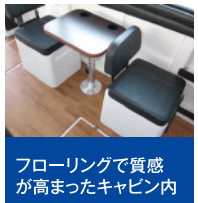
フローリングで質感が高まったキャビン内