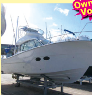
EX33IIフライングブリッジ仕様 H25.11月進水 オーナーY.M様