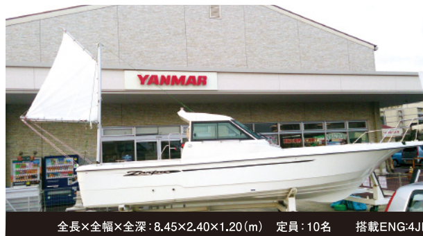
全長×全幅×全深: 8.45×2.40×1.20(m) 定員: 10名 搭載ENG: 4JH3-DTZA(115ps) 総トン数: 5.0G/T未満 航行区域: 限定沿海