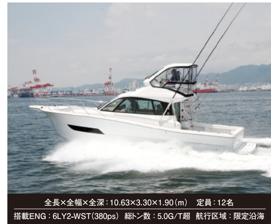
全長×全幅×全深: 10.63×3.30×1.90(m) 定員: 12名 搭載ENG: 6LY2-WST(380ps) 総トン数: 5.0G/T超 航行区域: 限定沿海

国産の33フィートモデルでは初めてのフライングブリッジモデルという事で、お問合せや見積依頼をたくさん頂いております。フライングブリッジモデルは、FB部からの爽快な景色が魅力で今までより高い位置から広がる視界が好評です! また、力強いエンジンで豪快に波を切り裂き、より遠くへ行くことも可能です。さらに、居住性のあるキャビンも人気の理由のひとつ。広いキャビンで楽しいひとときを過ごしてみませんか?