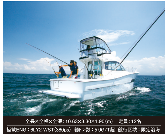
全長×全幅×全深: 10.63×3.30×1.90 (m) 定員: 12名 搭載ENG: 6LY2-WST(380ps) 総トン数: 5.0G/T超 航行区域: 限定沿海

フライングブリッジからの眺めは最高ですよ♪ 程よく風にあたりながらのんびりクルージングはいかがですか?